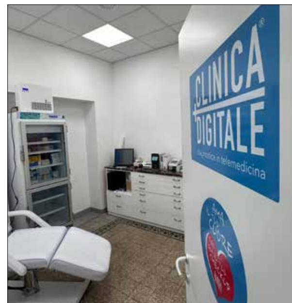
L'INTERNO DELLA FARMACIA DEI SERVIZI